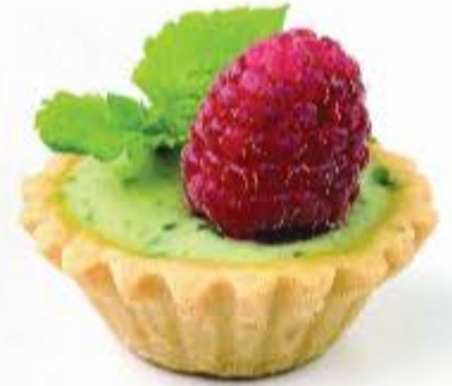
TEREYAĞLI MİNİ TARTALET 4,5 cm x 480 Adet