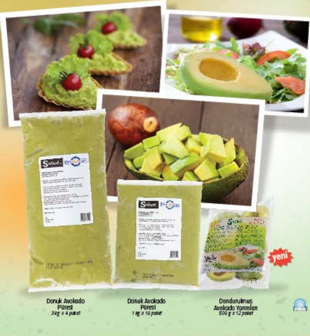
Donuk Avokado Püresi 3kg x 4 paket

Avokadonun ana vatanı Meksika ve Peru'daki dünyaca ünlü Hass avokadolarından üretilmiştir. Zaman ve işçilikten tasarruf sağlar, tüm yıl boyunca aynı lezzet ve kalitede olgun avokadolar kullanımınıza hazırdır.