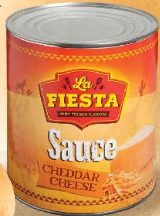
Çedar Peynirli Sos LF 3 kg x 3 adet