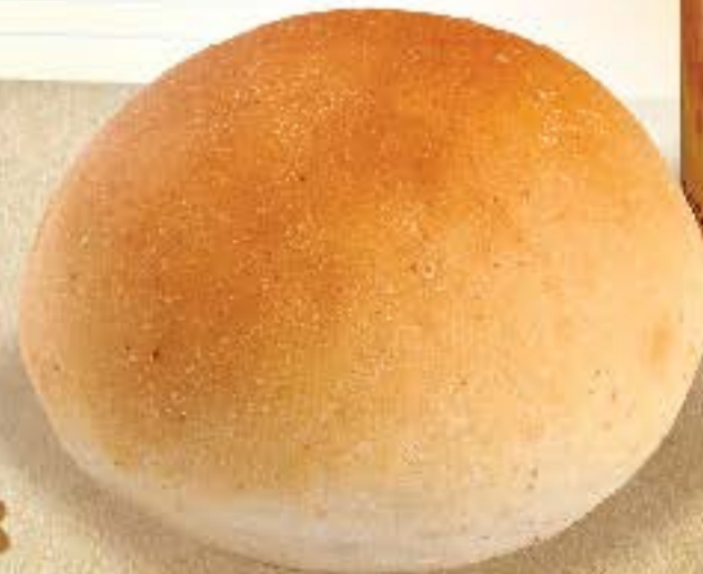
Tereyağlı Hamburger Ekmeği 30 gr x 20 adet x 5 paket