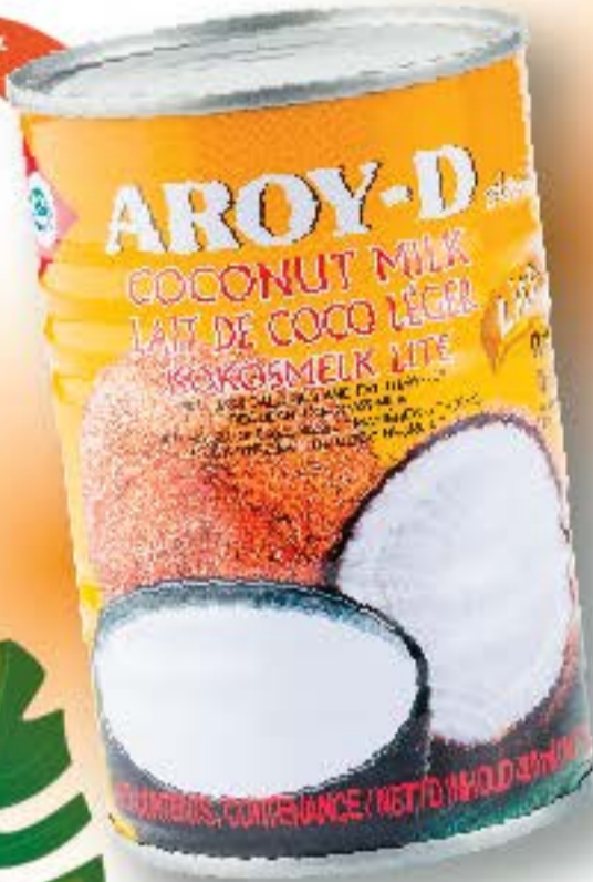
*Hindistan Cevizi Sütü - Light 400 ml x 24 adet