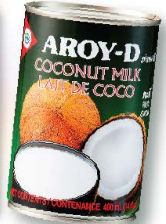
Hindistan Cevizi Sütü 400 ml x 24 adet