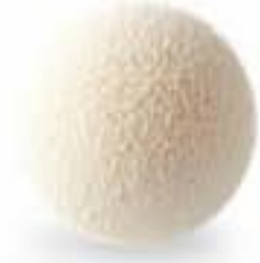
KARTOPU - DEKORATİF ŞOKO 40 Adet x 6 Kutu