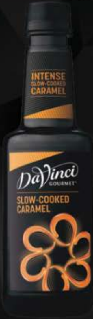
Slow Cooked Caramel