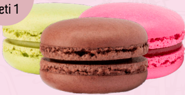
Antep Fıstıklı Çikolatalı Frambuazlı