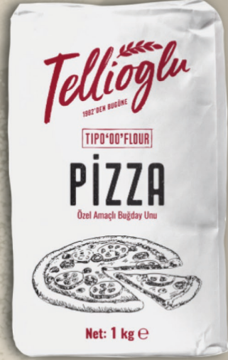
Pizza Unu 1 kg x 10 adet

%100 makarnalık durum(sert) buğdayından üretilerek irmiksi iri partikül yapısı hamurun daha fazla su almasıyla daha kolay açılabilir özellik sağlar. Pizza ve makarna gibi ürünlerde istenilen sarımsak rengi ve gevrek yapıyı sağlar.