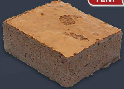
Yoğun Çikolatalı Brownie 1,680 gr (140 gr x 12 dilim) x 9 adet