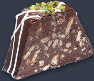
Mozaik Pasta 2,170 gr (155 gr x 14 dilim) x 6 adet