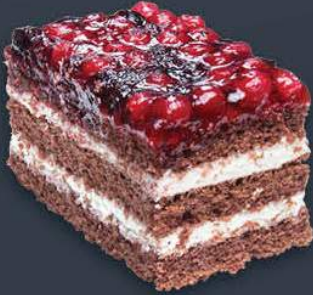
Orman Meyveli Mono Pasta 1200 gr (150 gr x 8 dilim) x 9 adet