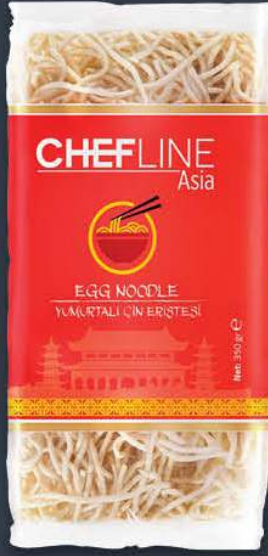
Yumurtalı Çin Eriştesi 350 gr x 50 adet / 350 gr x 25 adet