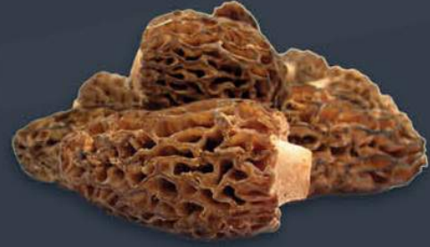
Morel (Kuzu Göbeği) Mantarı 1 kg x 5 paket