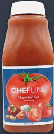
Napoliten Sos 2,25 kg x 6 adet