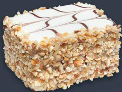
Toffee Latte 1,485 gr (165 gr x 9 dilim) x 9 adet