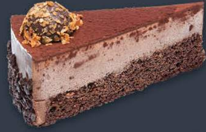
Trüf Cake 1,980 gr (165 gr x 12 dilim) x 6 adet