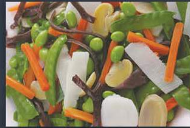
Uzakdoğu Sebze Karışımı 500 gr x 20 paket