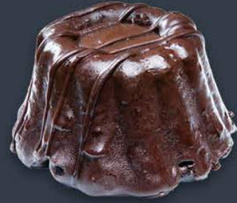
Çikolatalı Molten Cake 1,160 gr (145 gr x 8 dilim) x 9 adet