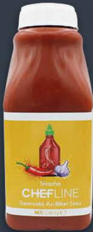
Sriracha Acı Biber Sos 2,48 kg x 6 adet