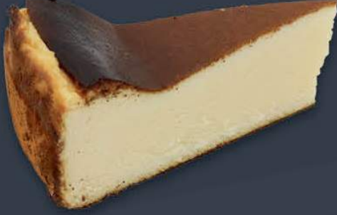
Yanık Bask Cheesecake 1,750 gr (145 gr x 12 dilim) x 9 adet