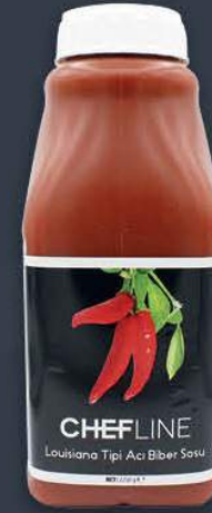
Louisiana Tipi Acı Biber Sos 2,25 kg x 6 adet