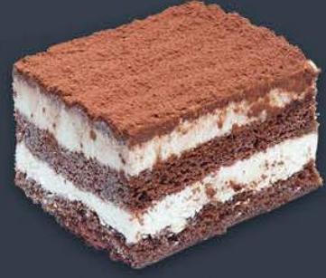
Kare Tiramisu 1,440 gr (160 gr x 9 dilim) x 6 adet