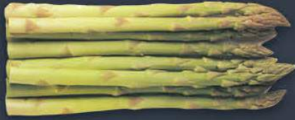
Yeşil Kuşkonmaz 17 cm 500 gr x 20 paket