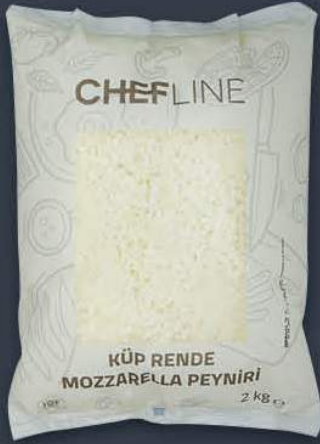
Küp Mozzarella 2,5 mm 2 kg x 6 paket