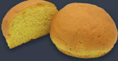
Turuncu Hamburger Bun 80 gr x 8 adet x 9 paket