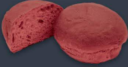
Kırmızı Hamburger Bun 80 gr x 8 adet x 9 paket