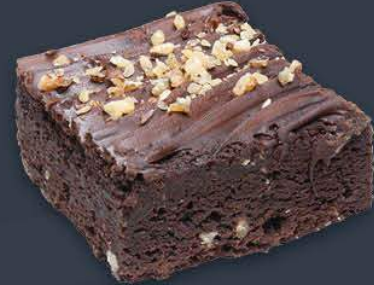
Cevizli Brownie 2,160 gr (120 gr x 18 dilim) x 6 adet