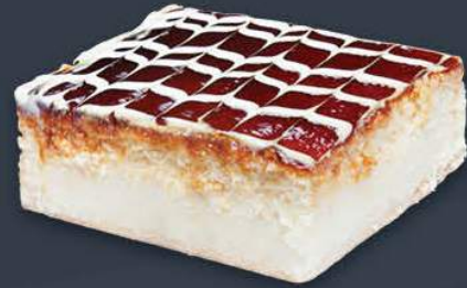
Karamelli Trileçe 1,600 gr (200 gr x 8 dilim) x 8 adet