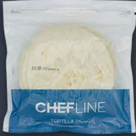
Tortilla Ekmeği 15 cm / 12 adet x 24 paket