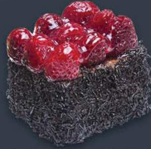
Çikolatalı Ahududulu Pasta 1,620 gr (180 gr x 9 dilim) x 6 adet