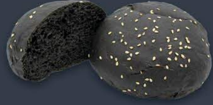
Siyah Hamburger Bun 80 gr x 8 adet x 9 paket