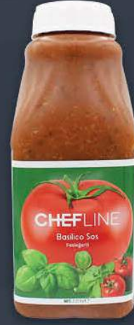
Basilico Sos 2,25 kg x 6 adet