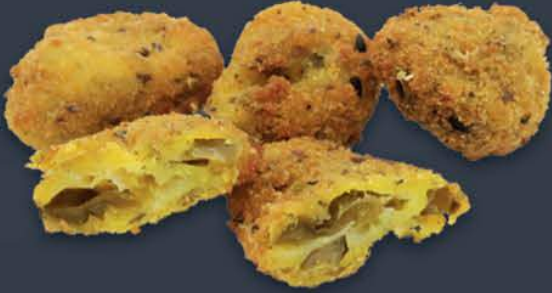
Çıtır Jalapeno Halkalar 1 kg (Ort. 147 Adet) x 5 paket