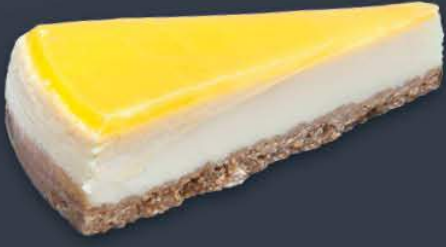
Limonlu Cheesecake 1,980 gr (165 gr x 12 dilim) x 9 adet