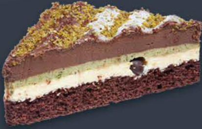
Antep Fıstık Üçgen Dilim 1,000 gr (125 gr x 8 dilim) x 9 adet