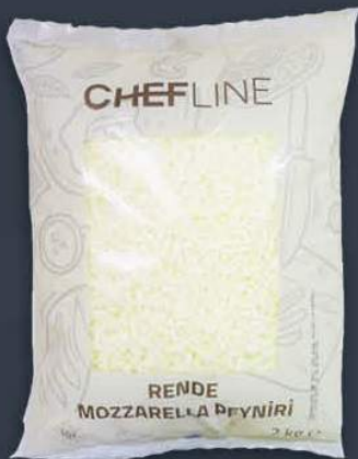
Rende Mozzarella 2 kg x 6 paket