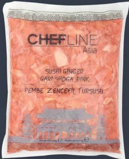
Pembe Zencefil Turşusu (Pink Gari Shoga) 1,5 kg x 10 paket