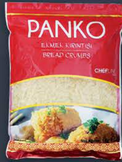
Panko Klasik Orta Boy Ekmek Kırıntısı 1 kg x 10 paket