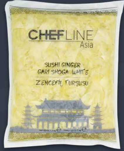
Zencefil Turşusu (Gari Shoga) 1,5 kg x 10 paket