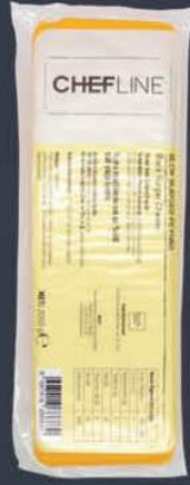
Blok Eritme Burger Peyniri 2 kg x 8 adet