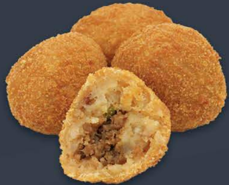
Kıymalı Arancini 1 kg (Ort. 50 adet) x 5 paket