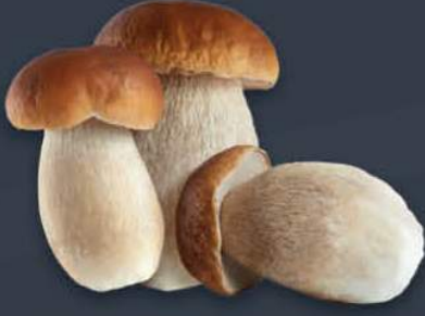
Porcini Mantarı No: 1 1 kg x 6 adet