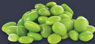
Soya Fasulyesi Tanesi 500 gr x 20 paket