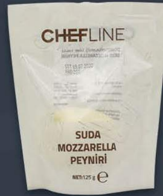
Suda Mozzarella 125 gr x 40 paket