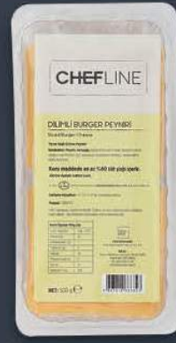
Dilimli Burger Eritme Peyniri 500 gr x 18 adet