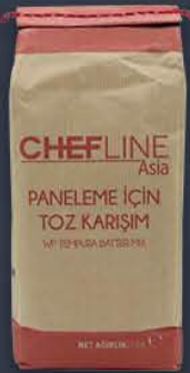
Tempura Pane Karışımı 1 kg x 12 paket