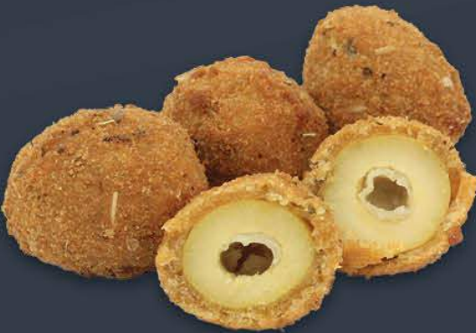
Çıtır Zeytin 1 kg (Ort. 159 adet) x 5 paket