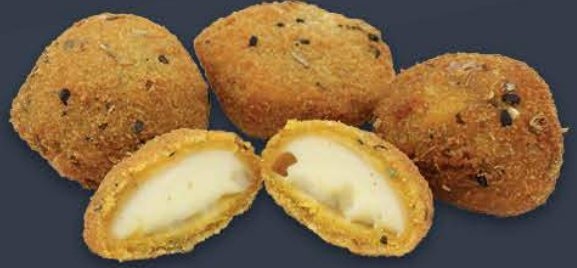
Mozeralla Topu (Kekikli) 1 kg (Ort. 67 adet) x 5 paket