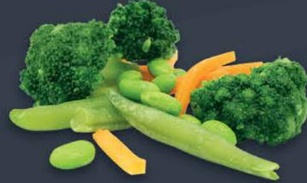
Bahçe Sebze Karışımı 500 gr x 20 paket