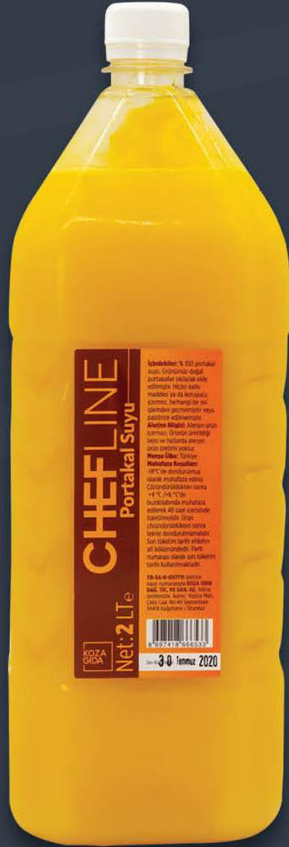
Portakal Suyu 2 lt x 6 adet