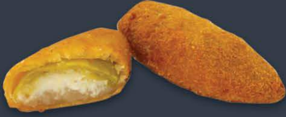
Jalapeno Poppers 1 kg (Ort. 29 adet) x 5 paket