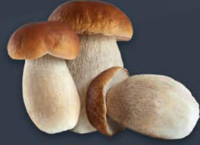
Porcini Mantarı No: 2 6 kg x 1 paket