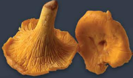
Sarıköz Mantarı Chantarelle 1 kg x 8 paket