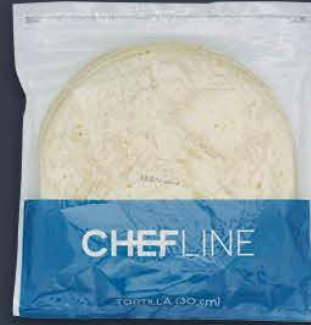
Tortilla Ekmeği 30 cm / 18 adet x 6 paket