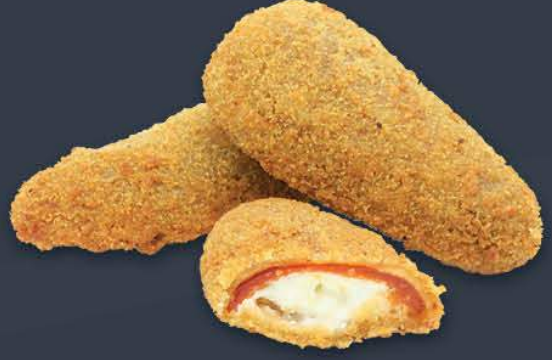
Red Hot Jalapeno Poppers 1 kg (Ort. 29 adet) x 5 paket