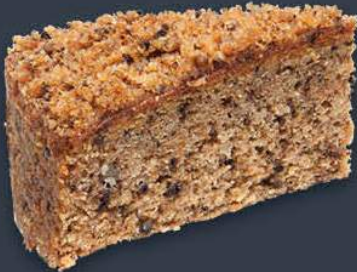
Havuçlu Kek 1,300 gr (130 gr x 10 dilim) x 9 adet