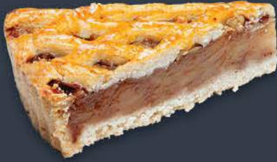
Elmalı Tart 1,500 gr (150 gr x 10 dilim) x 9 adet