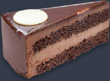
Devil's Fudge Cake 2,040 gr (170 gr x 12 dilim) x 6 adet