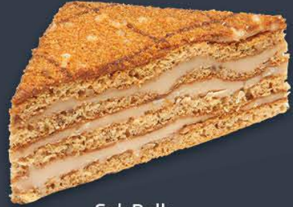
Çok Ballı 1,240 gr (155 gr x 8 dilim) x 6 adet