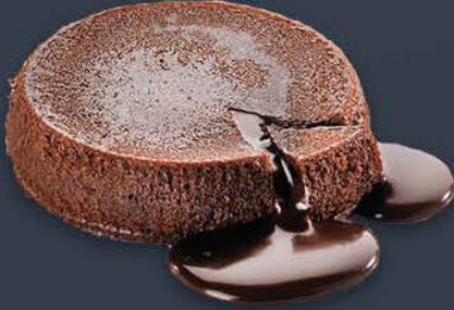
Sufle 140 gr x 24 adet x 6 kutu