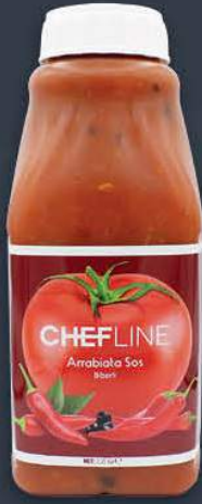
Arrabiata Sos 2,25 kg x 6 adet