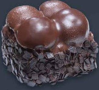
Siyah Profiterollü Pasta 1,575 gr (175 g x 9 dilim) x 6 adet