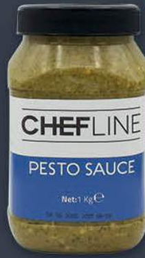
Pesto Sos 1 kg x 6 adet