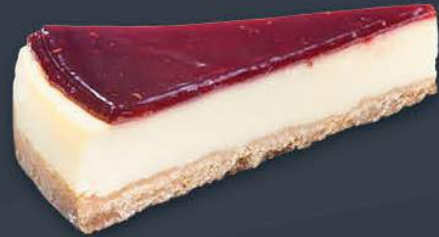
Frambuazlı Cheesecake 1,980 gr (165 gr x 12 dilim) x 9 adet