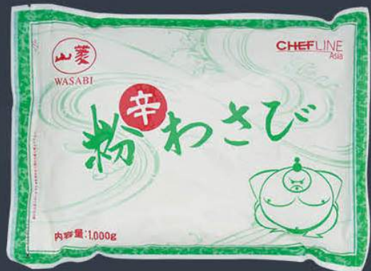
Toz Wasabi 1 kg x 10 paket