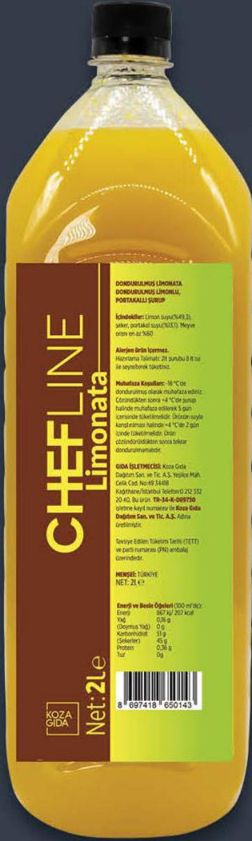
Limonata Bezesi 2 lt x 6 adet