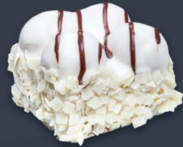
Beyaz Profiterollü Pasta 1,575 gr (175 gr x 9 dilim) x 6 adet