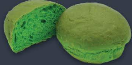
Yeşil Hamburger Bun 80 gr x 8 adet x 9 paket