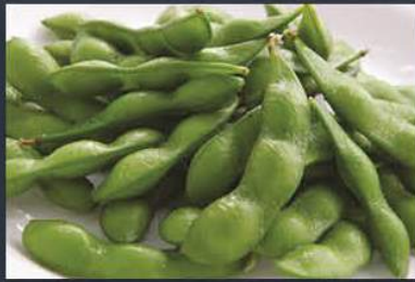
Edamame-Soya Fasulyesi 2,5 kg x 4 paket