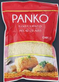
Panko (Japon Ekmek Kırıntısı) 200 gr x 20 paket